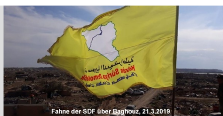
Fahne der SDF über Baghouz, 21.3.2019