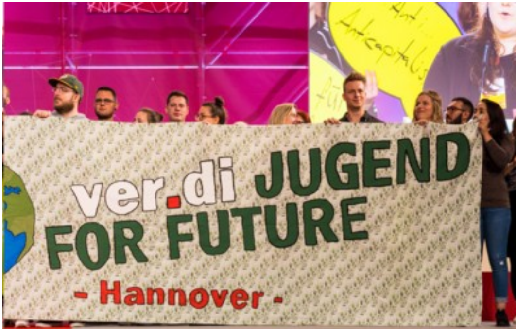
ver.di Bundeskongress, 22.-28.9.19 in Leipzig

Leidenschaftlich war dann nicht nur die Debatte zu den Klimaanträgen, zur Arbeitszeit, zu Frieden und Abrüstung, zur Rente und gegen die AfD.